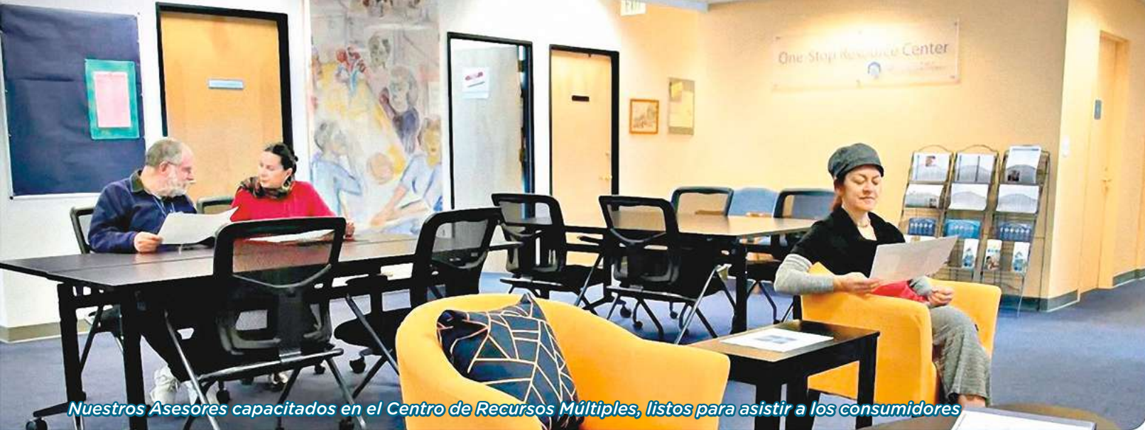
Nuestros Asesores capacitados en el Centro de Recursos Múltiples, listos para asistir a los consumidores