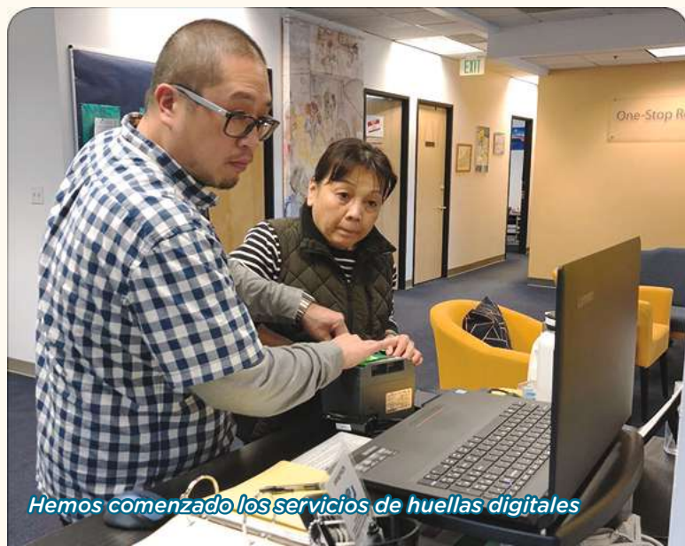
Hemos comenzado los servicios de huellas digitales