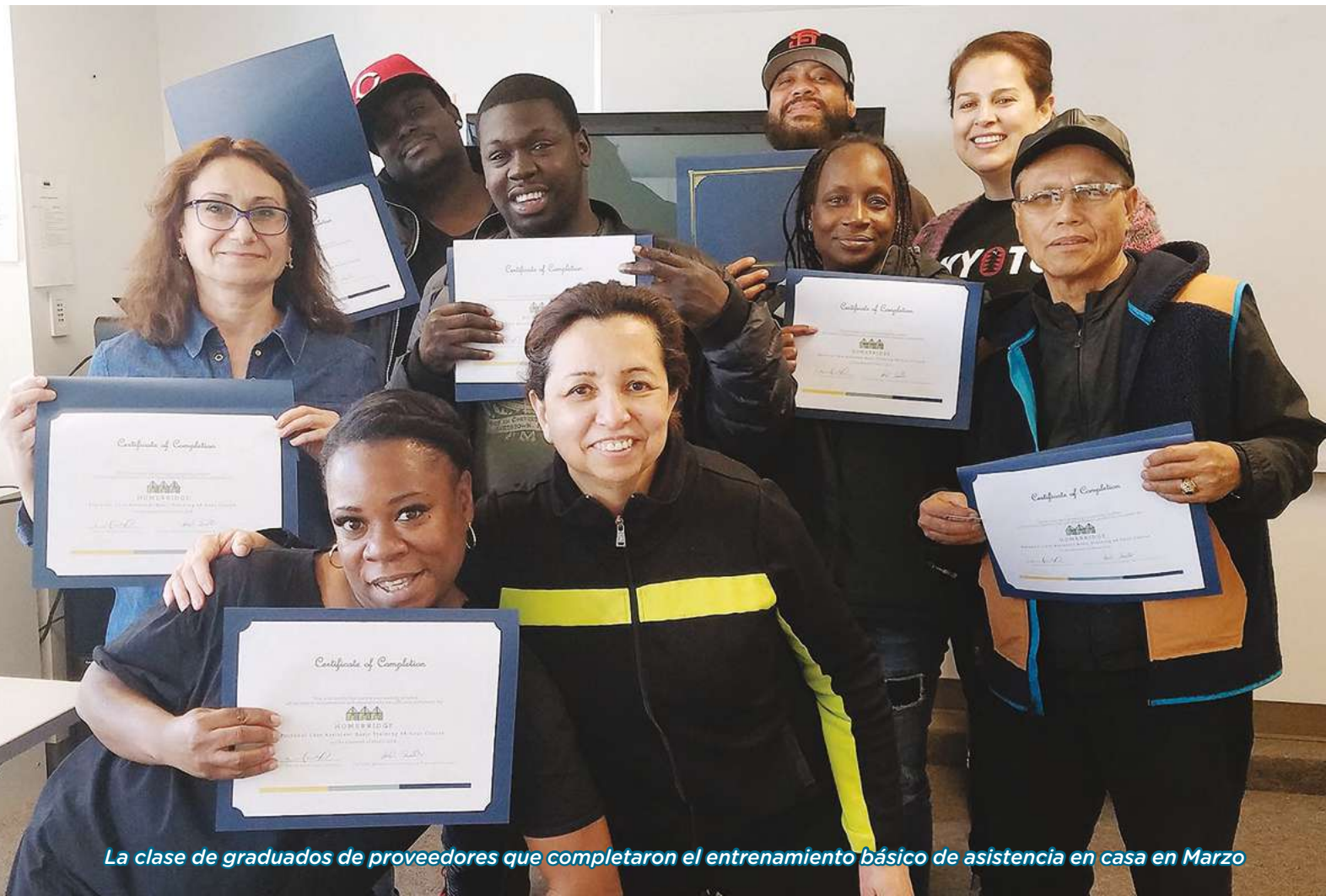
La clase de graduados de proveedores que completaron el entrenamiento básico de asistencia en casa en Marzo